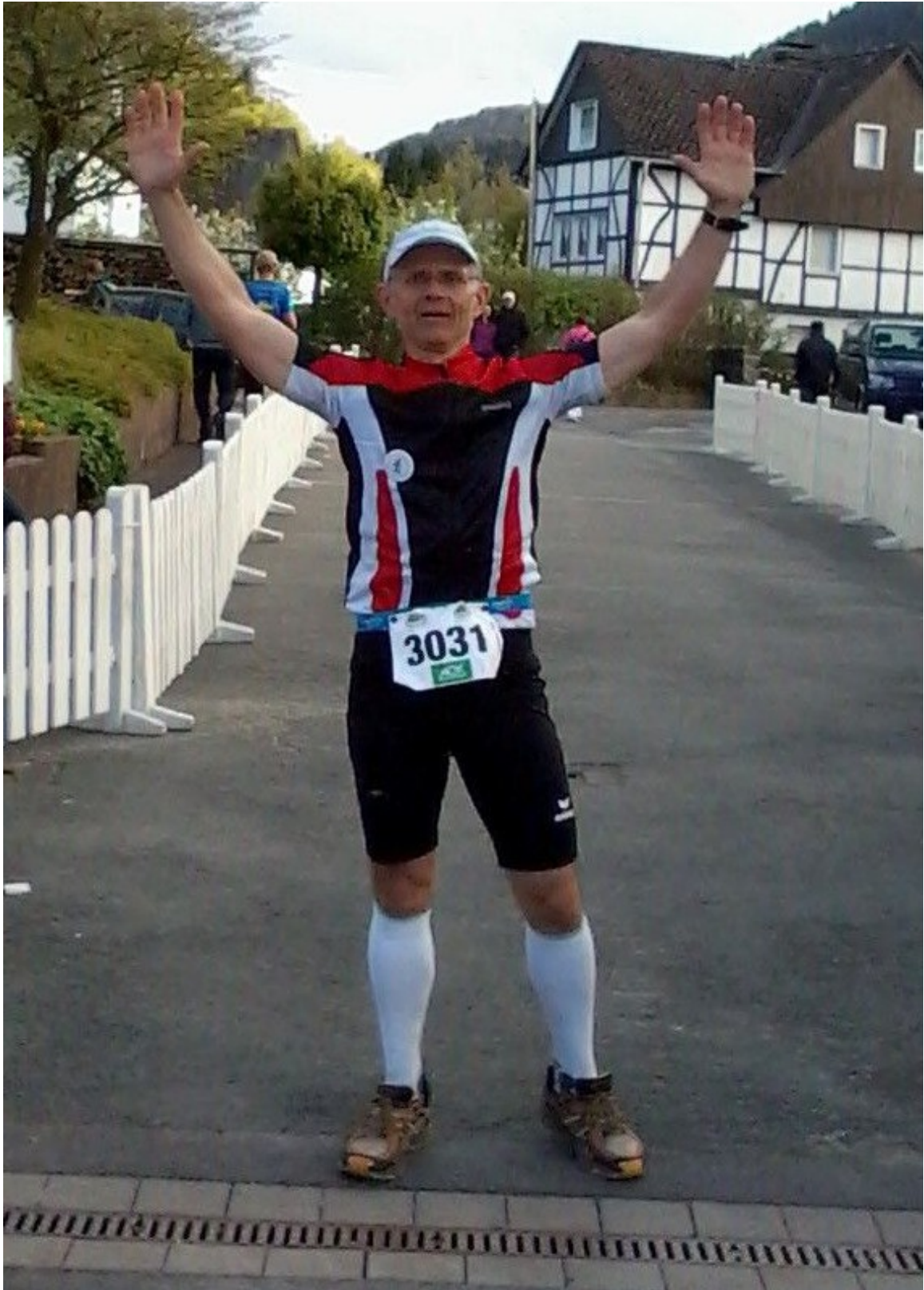
Auszug aus Wikipedia: